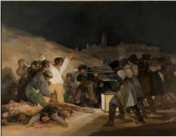
GOYA, Francisco. Três de maio em Madri ou Fuzilamento (1814)