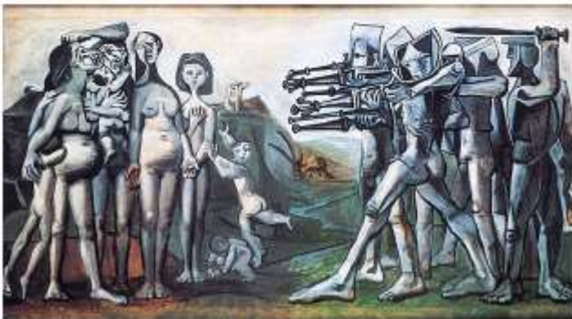
PICASSO, Pablo. Massacre na Coreia (1951)

As obras de Goya e Picasso são uma denúncia contundente da violência e da guerra. Na segunda metade do século XX, Picasso se inspirou diretamente na obra de Goya para criticar as atrocidades que estavam sendo cometidas na Guerra da Coreia.