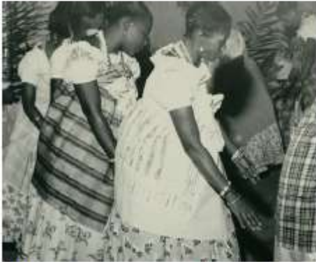
Integrantes de roda de candomblé (Brasil).

Com base nas imagens, assinale a opção que indica corretamente o significado social dessas danças para seus praticantes.