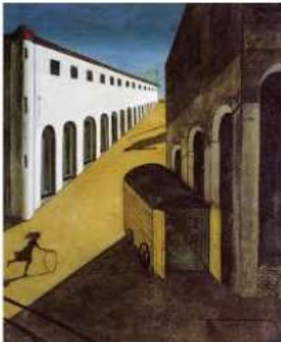
I - DE CHIRICO, Giorgio, Melancholia e mistério na rua (1914).

No século XX, a arte moderna reapropria-se livremente da perspectiva renascentista, como exemplificado nas obras a seguir.