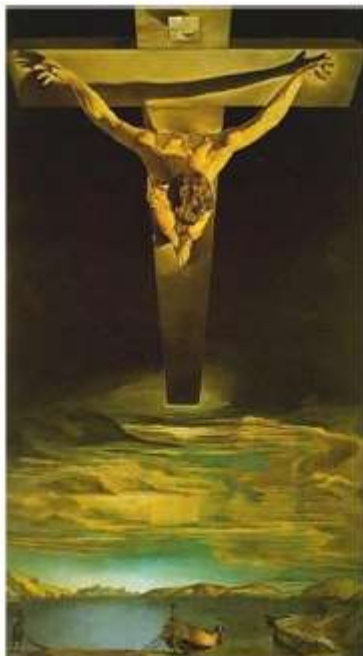
II - DALÍ, Salvador, Cristo de São João da Cruz (1951).

A partir das imagens, analise as afirmativas a seguir e assinale V para a verdadeira e F para a falsa.