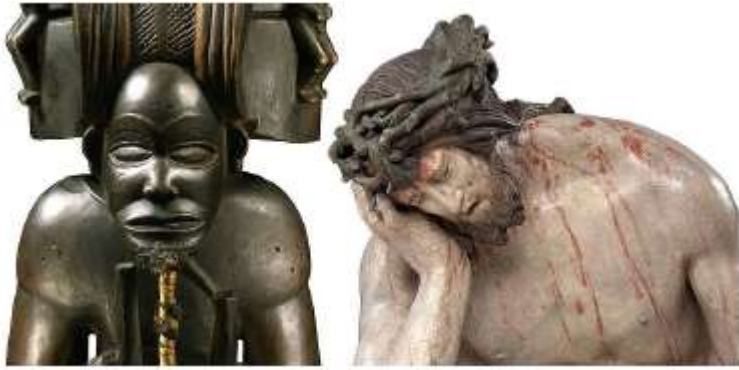
Chibinda Ilunga (Angola século XIX - rei divino) / Cristo sofredor (Alemanha, 1525).

A exposição "Além da Comparação" exibiu lado a lado obras de dois acervos, o de arte africana do Museu Etnológico alemão, e o de arte medieval e renascentista do Bode-Museum de Berlim. Essa justaposição de obras de dois continentes evidenciou possíveis correlações, desde a simultaneidade da ação artística no tempo até as semelhanças no plano iconográfico e técnico. Por exemplo, figuras de reis divinos eram veneradas em Angola, do mesmo modo que a origem divina da realeza era representada na figura de Cristo na Alemanha.