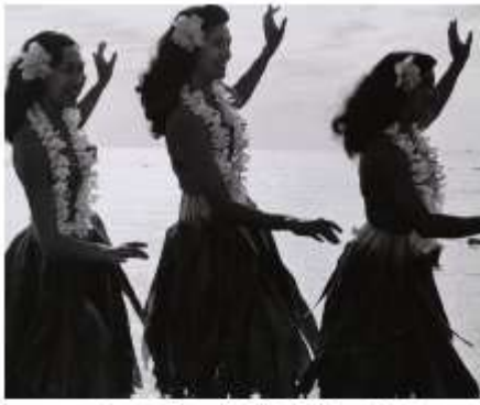
Dançarinas de Hula (Havai).